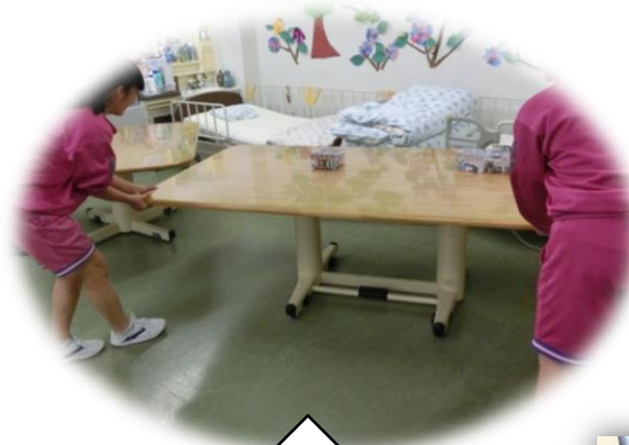
テーブルの準備をしっかりと！ (やすらぎ園)