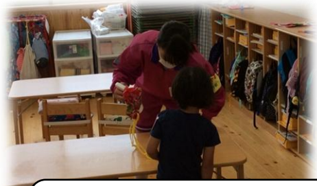
園児の給食準備! しっかり机を 消毒! (味間認定こども園)