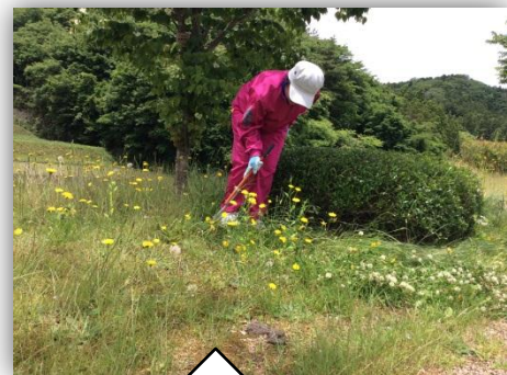
並木道公園で作業中!