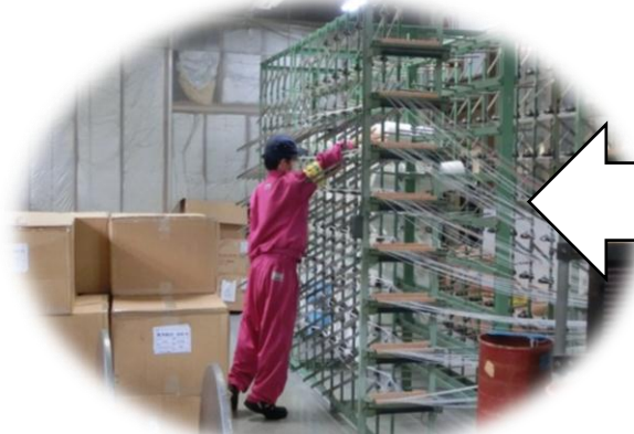
芦森工業、細 かな機械が たくさん!