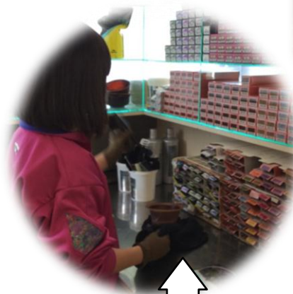
使用済みのブラシをしっかりと洗浄 (ヘアリング)

トライやる・ウィークが終わりました。保護者の皆様にもお弁当の準備をしていただくなど、大変お世話になりました。また活動日誌も毎日目を通していただき、コメントを書いていただき、本当にありがとうございます。学校とは違う様々な活動を通じて、お子様たちは貴重な体験ができたと思っています。そこで気づいたこと、学んだことをこれからの生活に生かしてほしいと願っています。またご家庭でも、トライやる期間中は、たくさんお話をされたと思います。これからも社会の良き先輩としてたくさんのアドバイスをいただければと思います。よろしくお祈りします。