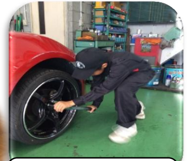
タイヤの取り付け体験 (ホンダカーズ)