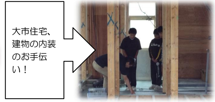
大市住宅、 建物の内装 のお手伝 い!