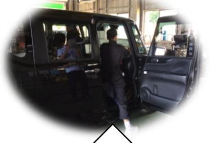
指導ボランティアに教わりながら、 ナビ取付中！（大木モータース）