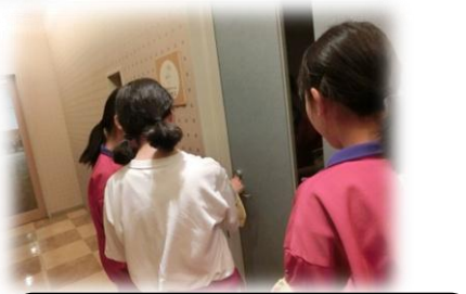
一部屋ずつしっかりチェック! (ユニットピアささやま)