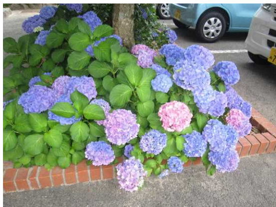
職員駐車場のあじさいです! 1本の木に色々な色の花が! グラデーションもあります!