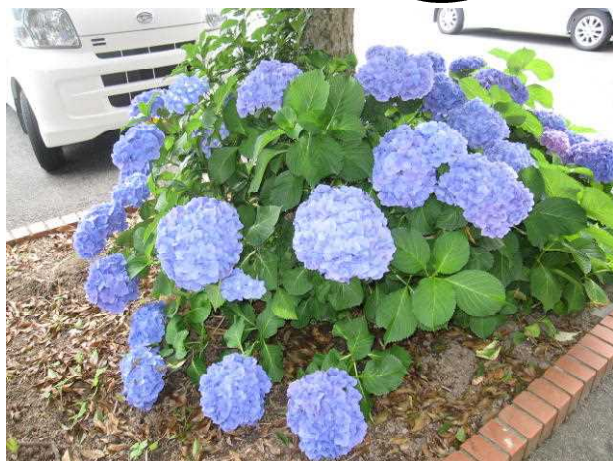
このあじさいは、3年生の靴箱に面しています 終わりの会が終わって、一目散に部室へ走る 3年生をいつも見守っています!